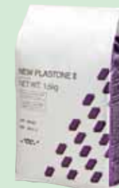
超硬石こう ニューフジロック 硬石こう ニュープラストーンII