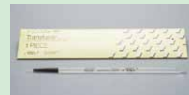
埋没材注入用インストゥルメント トランスフューザー