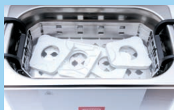
石膏用マウンティングプレート