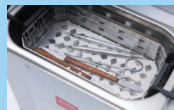
インスツルメント