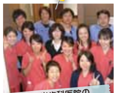
貞光歯科医院の スタッフのみなさん。

ルシェロが登場し、患者さんの口腔内に合わせて処方するコンセプトがしっかりしているので歯ブラシの選択に迷うことがなくなり、非常に感謝しております。また当院ではルシェロを受付にディスプレイしていますが、デザイン性の良さもあり患者さんにも手に取って歯ブラシを見る機会が増え、ルシェロは経営面でも貢献しております。