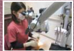
最終チェックはマイクロスコープを使っています。