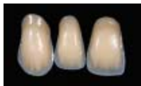
象牙質の指状構造

デンティン層とカラー層を唇舌両面からエナメル層でサンドイッチ、天然歯の構造にさらに近づけました。特に切端部舌面もエナメル色にすることで、内部の明瞭な指状構造を絶妙にぼかし、自然な透明感を表現しています。また、口蓋側からの外観や臼歯への連続性も自然に仕上がり、患者さんの満足感が得られます。