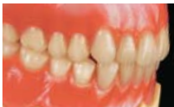
臼歯への連続性も違和感がありません