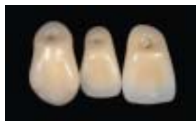
口蓋面からの審美性も向上