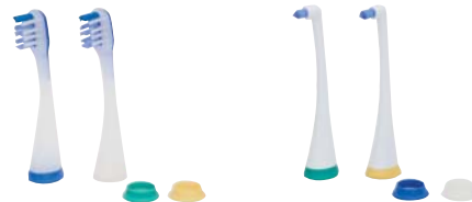
カーブフロートブラシ (ブラシ2本、識別リング4色) 1セット 希望患者価格 ¥945(税込)