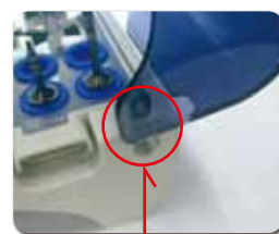
▲ヒンジもワンタッチで取り外し可